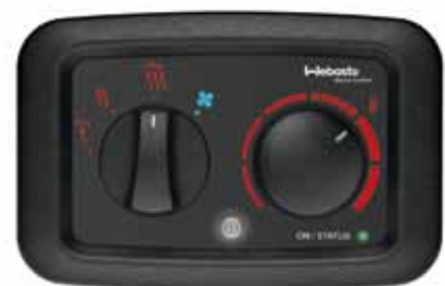
Elément de commande multi fonctions Air Top Evo

Pour voir la gamme complète des produits Webasto, consultez le catalogue Marine.