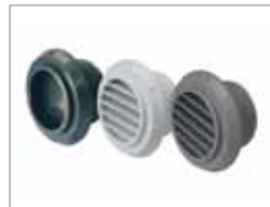
Système de canalisation d'air chaud Webasto (HADS)