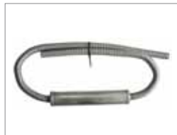
Silencieux d'échappement Webasto